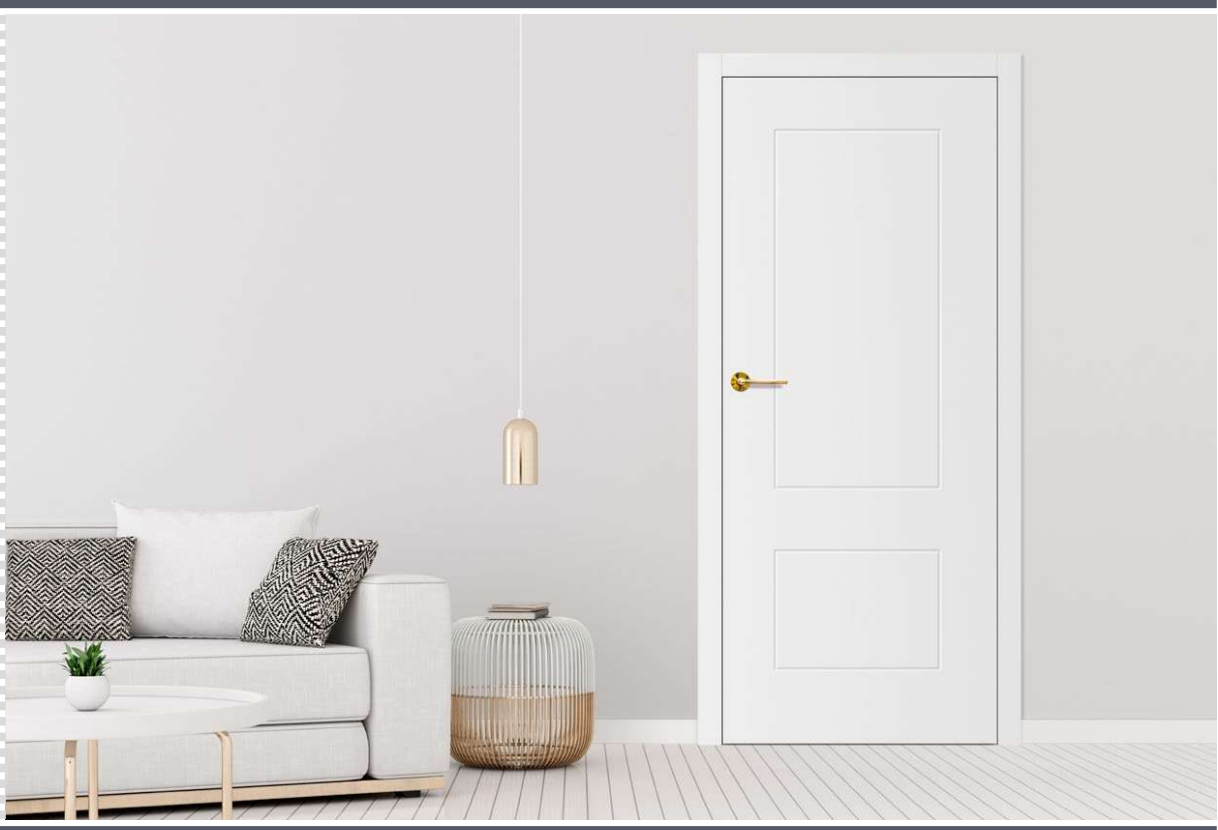
ANUBIS 2, kvaka BELLA slim sjajni mesing