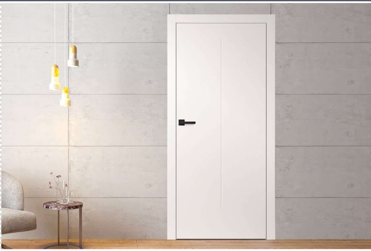
SYLENA 2, kvaka CUBE crni mat