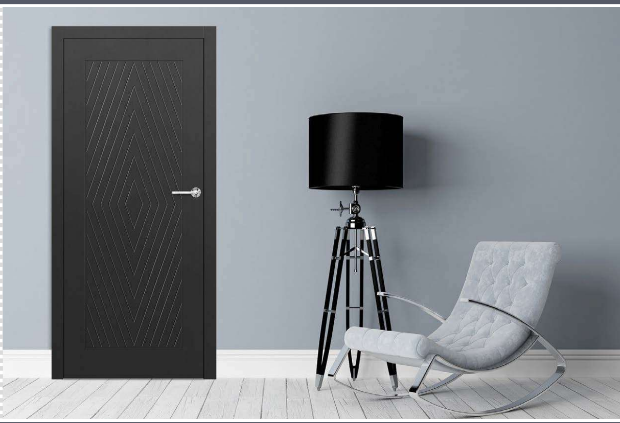
TURAN 3, kvaka BELLA slim okruga sjajni mesing