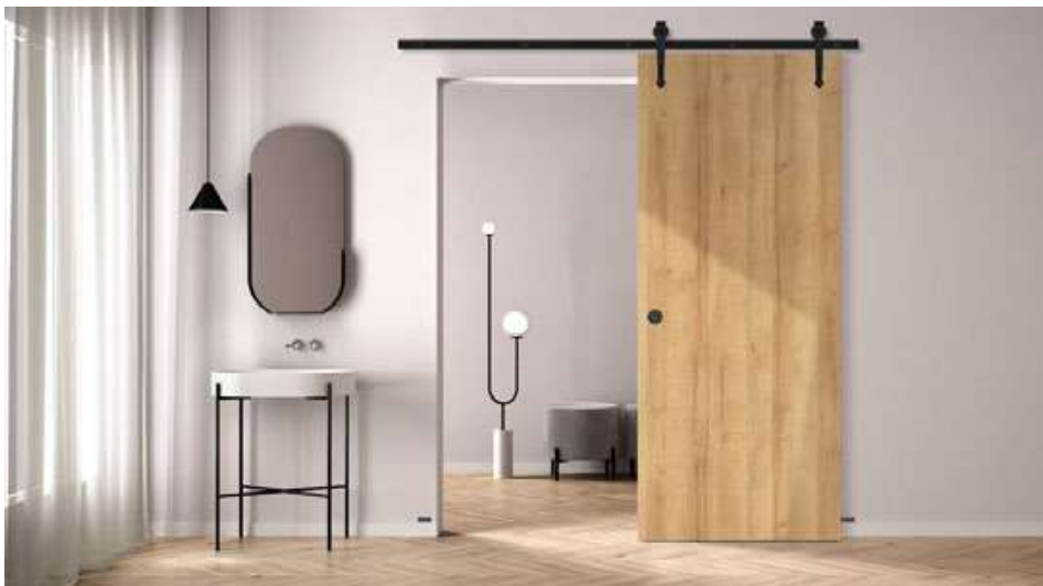
Krilo LOFT, dekor HRAST ST CPL, okrugli rukohvat, RETRO kvake

Zidni klizni sustav tipa LOFT dostupan je u crnoj boji i u kompletu, s punim krilom tipa LOFT. Vratno krilo tipa LOFT standardno je opremljeno stabilizirajućom ispunom "saće" ili punim pansionom uz nadoplatu. List ima prednost u tehnologiji bez falca. Sustav je za gotovu rupu, nema dostupnog tunela.